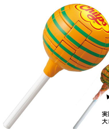
チュッパチャプスパズル マンゴー 難易度：むずかしい