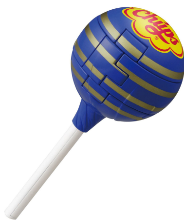
チュッパチャプスパズル コーラ 難易度：ふつう