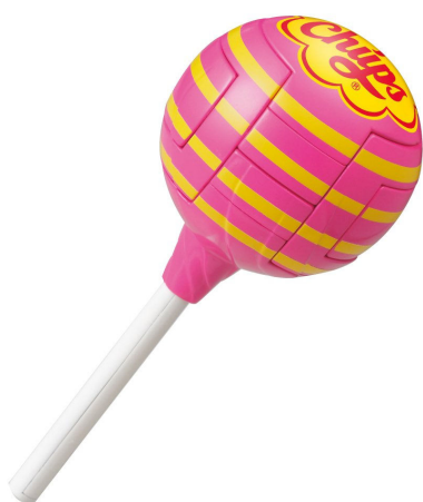
チュッパチャプスパズル ストロベリークリーム 難易度：やさしい

『チュッパチャプスパズル』の遊び方は二通りあり、先ずパズルになっているキャンディー部分のピースを外すことから始めます。組み木のような作りになっているので、ひとつひとつを順番に外していかないと、バラバラにすることはできません。外し終わったら、次は元に戻していきます。その時も順番に組んでいかないと戻すことができないので、さらに難易度がアップします。